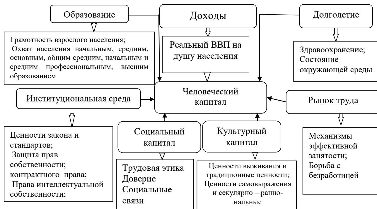
Рисунок 3- Факторы, косвенно влияющие на состояние и уровень развития человеческого капитала

В работе выявлены факторы, влияющие на уровень развития человеческого капитала в общеобразовательных учреждениях на основе оценки их потенциала, который отражает их материально-технические и организационно-экономические возможности (рис.3).