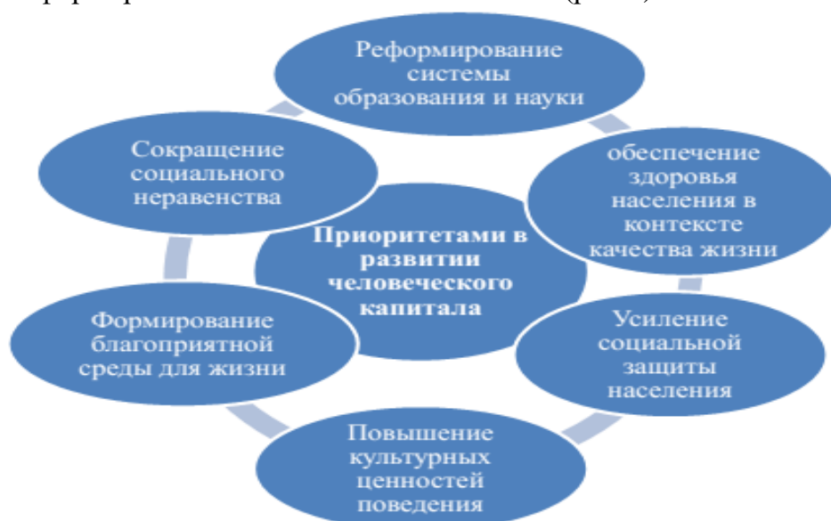
Рисунок 1 – Основные приоритеты в формировании человеческого капитала (составлено автором)

Основным фактором для обеспечения экономического роста является человеческий капитал, занимающий ведущее место среди факторов, обеспечивающих развитие отраслей и сфер экономики. Поэтому в работе выделены основные приоритеты в формировании человеческого капитала (рис.1).