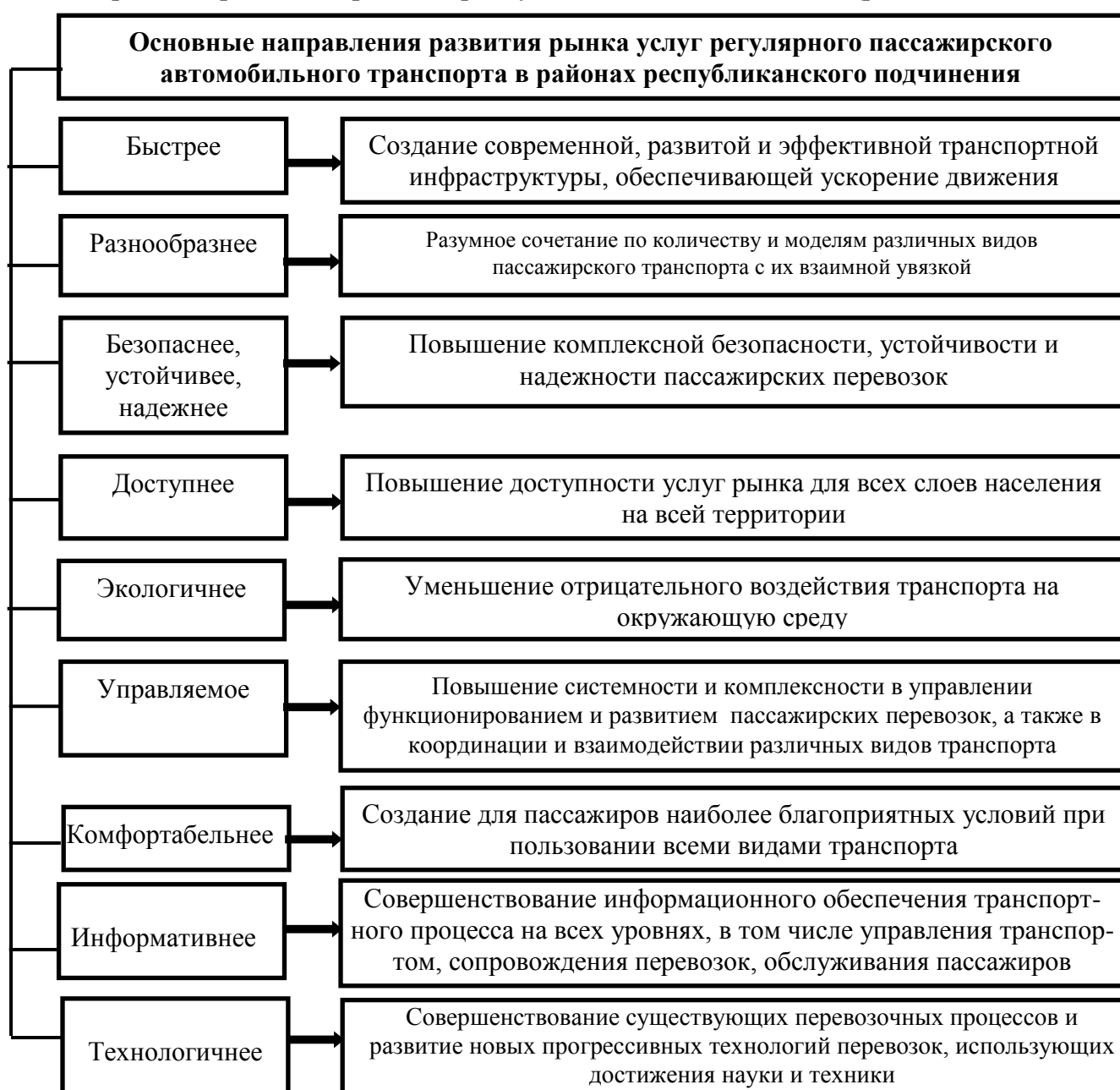
Рисунок 3 - Основные приоритеты комплексного развития рынка услуг регулярного пассажирского автомобильного транспорта в районах республиканского подчинения

На основе проведенных исследований и полученных результатов в диссертации предложены основные стратегические направления развития рынка регулярных пассажирских перевозок в районах республиканского подчинения (рис.3).